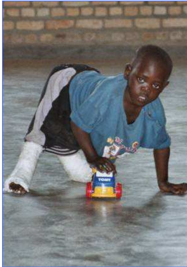
Diminués mais pas tristes, ô non pas tristes !