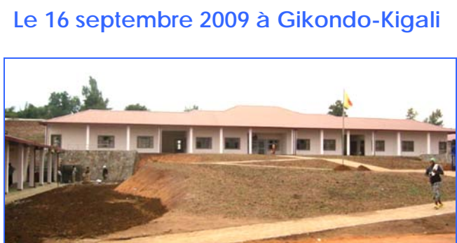
Le Centre d'Accueil et d'Orientation où seront accueillis, diagnostiqués et pris en charge les enfants handicapés de tout le Rwanda