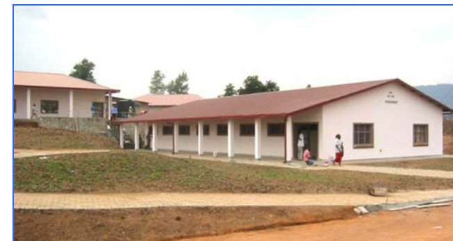
Les Ateliers de Kinésithérapie où les enfants de Kigali recevront massages et soins