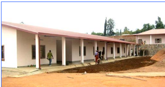
Les Ateliers d'Orthopédie où les enfants de Kigali recevront et entretiendront leurs appareils