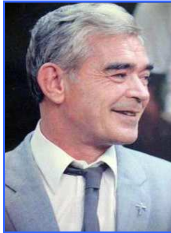
Abbé Joseph Fraipont

"Parce qu'un jour, mes yeux ont croisé les yeux de jeunes délaissés, yeux sans colère, mais si las, si remplis de désespoir, je ne pouvais plus être le même. Il fallait aimer, il fallait agir"