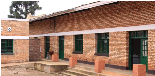
La section A1 Laborantins