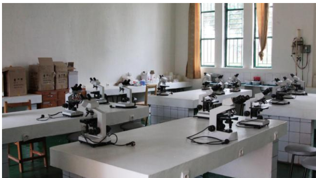
Le rêve de Séraphine : Laborantine A1 à Butare

(Gaspard MBONIGABA coordinateur des parrainages)