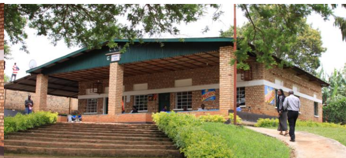
Le réfectoire des A1