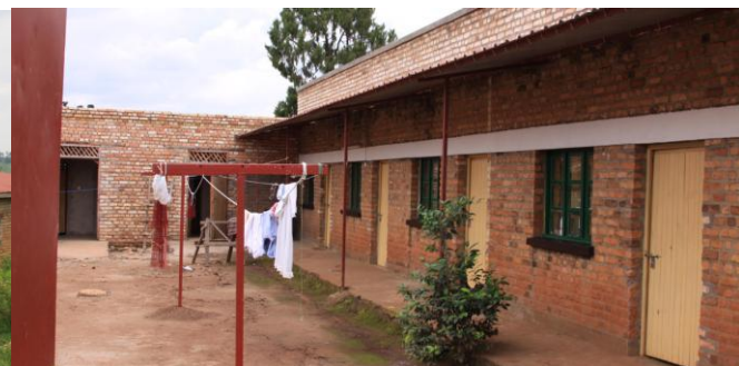
Le dortoir des filles A1