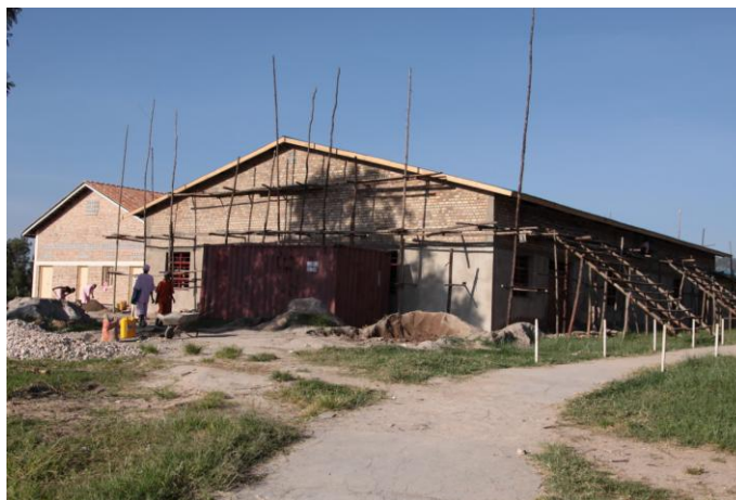
La nouvelle Cuisine et le nouveau Réfectoire