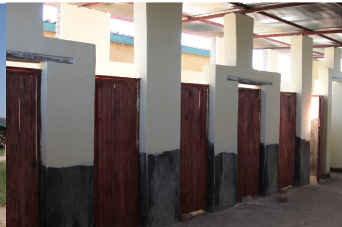
Des douches pour les filles