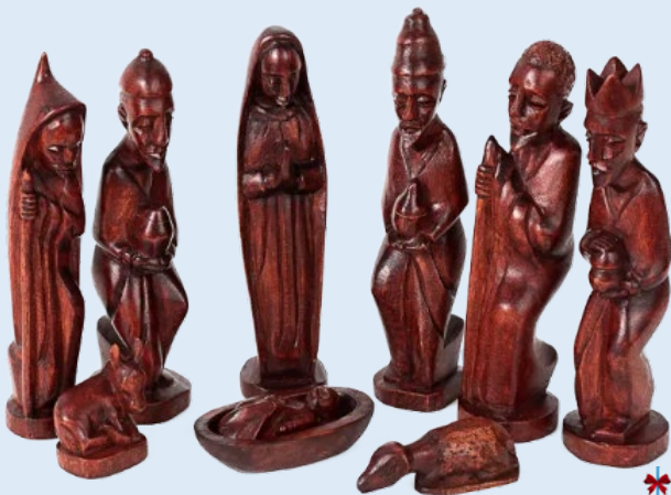
Crèche sculptée par Aimable Ngabikeye, un artisan handicapé de la Cooperative Inganzo à Muhanga.

UNDP a accepté de donner plus de 10 écrans interactifs pour faciliter l'apprentissage aux jeunes handicapés mentaux pour HVP Gatagara Gikondo Ils ont aussi accepté de donner les mêmes outils dans les autres centres de HVP Gatagara (Butare et Nyanza). Ils ont donné l'internet (free internet) au Groupe Scolaire HVP Gatagara Nyanza. UNFPA a donné plus de 3500 cotex pour les jeunes élèves dans tous les centres du HVP Gatagara. Ils ont aussi promis qu'ils vont continuer à planifier comment améliorer les conditions hygiéniques des filles handicapées.