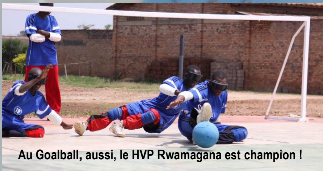
Au Goalball, aussi, le HVP Rwamagana est champion !